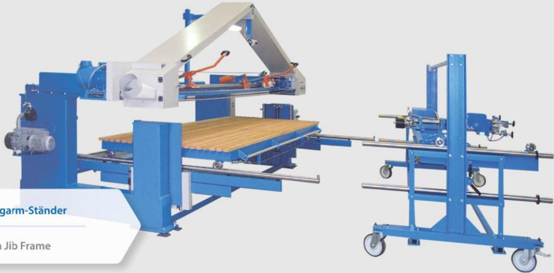
ZBS mit Kragarm-Ständer