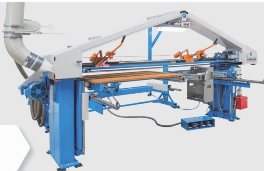
ZBS mit Kragarmtisch

ZBS with Motorized Scissors Lift Table and Indexing Station