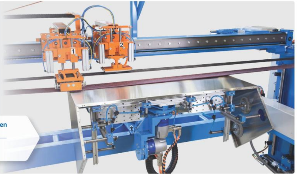
ZBS mit motorisch angetriebenen Schwenkachsen