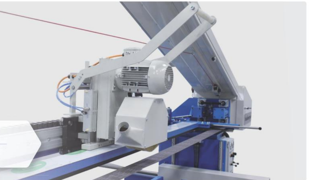
ZBS mit Bürstenaggregat