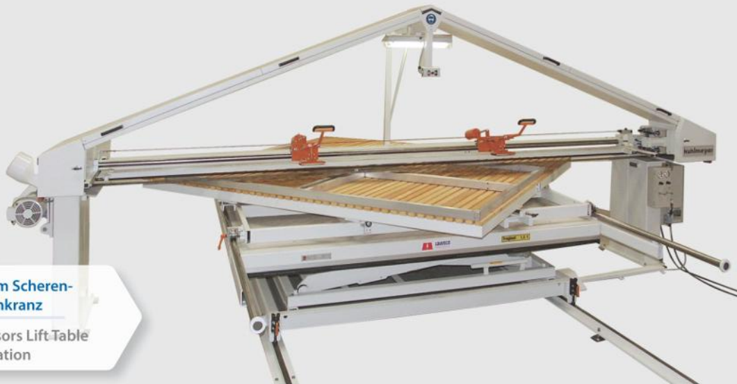
ZBS mit angetriebenem Scherentisch und Drehkranz

ZBS with Motorized Scissors Lift Table and Indexing Station