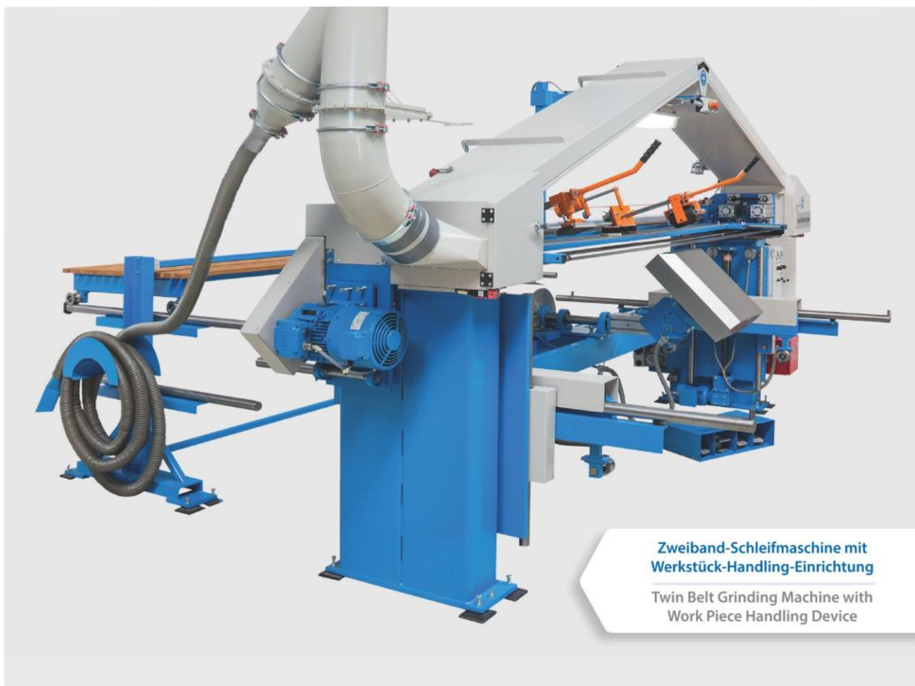
Zweiband-Schleifmaschine mit Werkstück-Handling-Einrichtung

Twin Belt Grinding Machine with Work Piece Handling Device