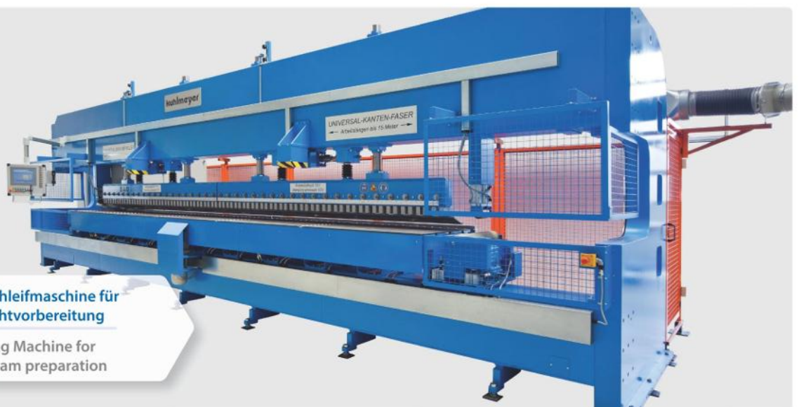
Kanten-Fasen-Schleifmaschine für die Schweißnahtvorbereitung

Long Belt Grinding Machine for plate sizes up to 12 x 18 m