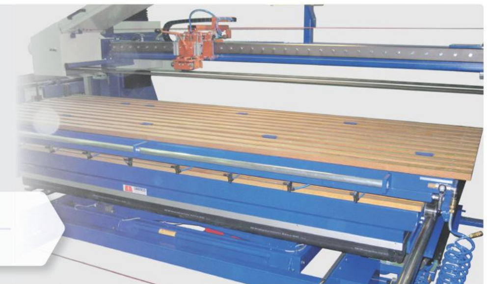
ZBS mit Verteilerrohr und Saugspannern