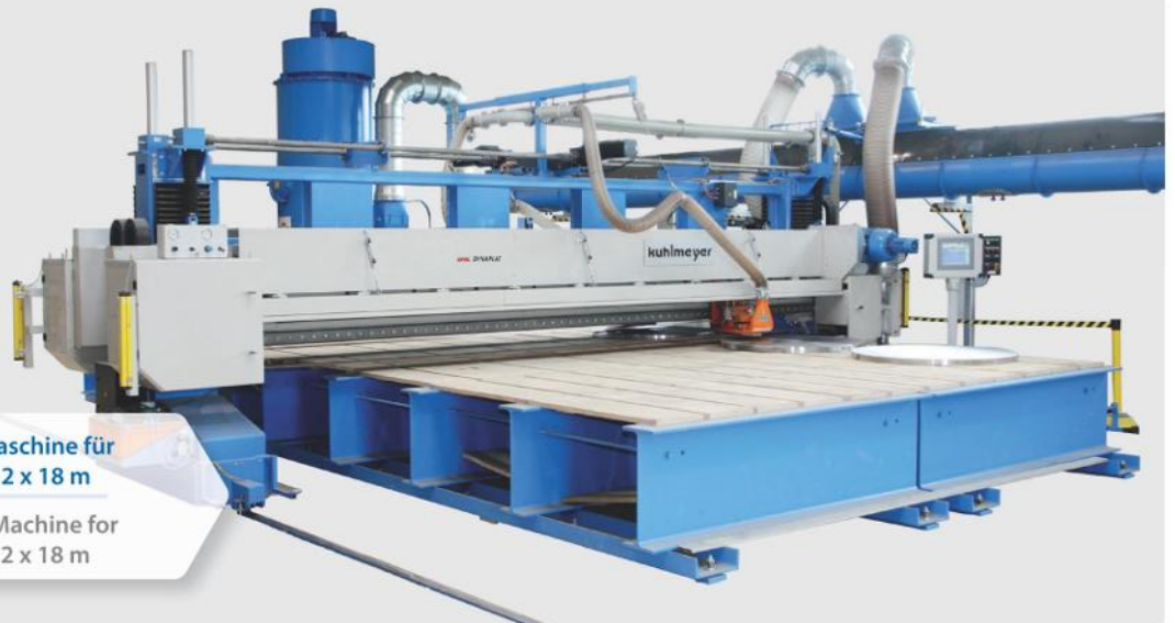
Langband-Schleifmaschine für Blechgrößen bis 12 x 18 m

Long Belt Grinding Machine for plate sizes up to 12 x 18 m